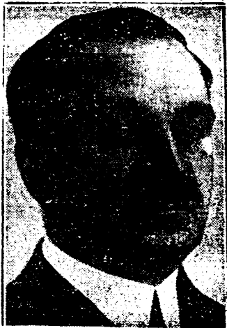
Minister-president Maniu, die het militair complot deed mislukken.